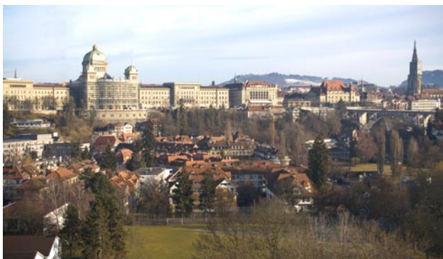
Sicht auf Bundeshaus/Münster/Altstadt Entwicklungsgebiet Marzili