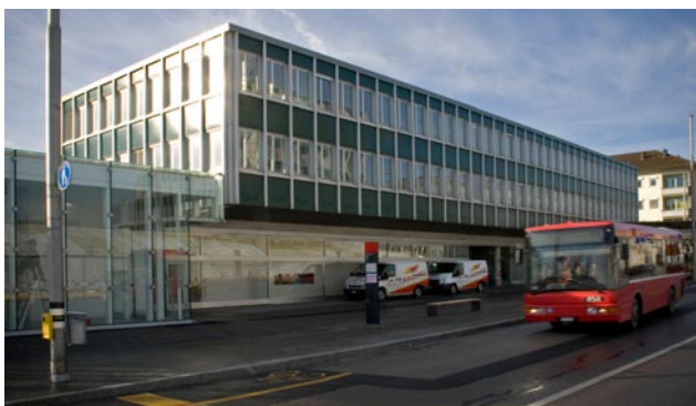
Verkehrstechnisch mit ÖV erschlossen 25'000 Autos pro Tag Erschliessung Marzili-Eigerstrasse mit öffentlichem Glaslift